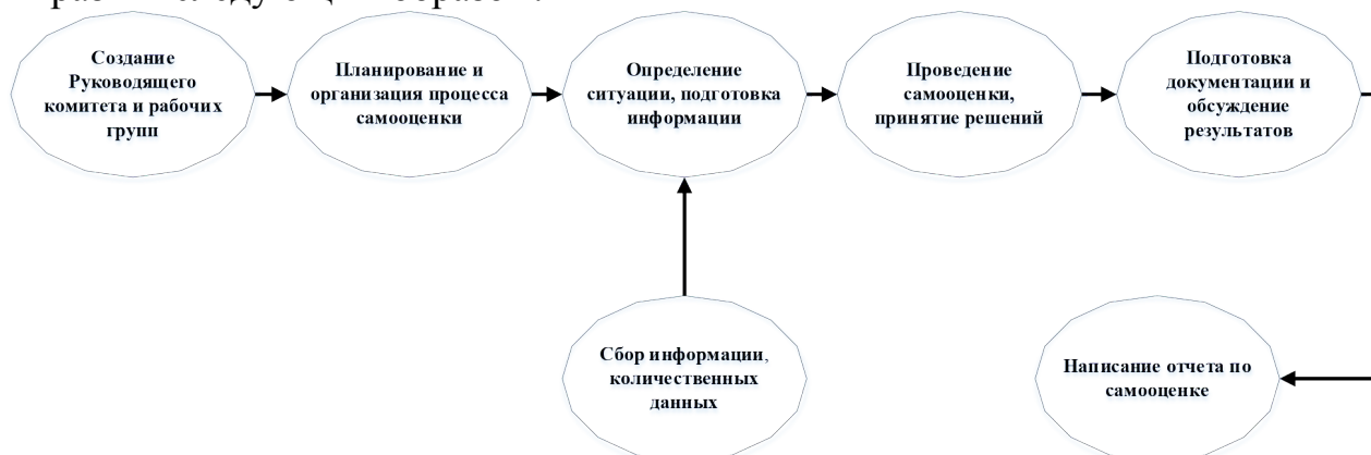
Рисунок 3. Общая схема процесса самооценки и координации действий

реализации ОП. Общую схему процесса самооценки и координации действий можно выразить следующим образом: